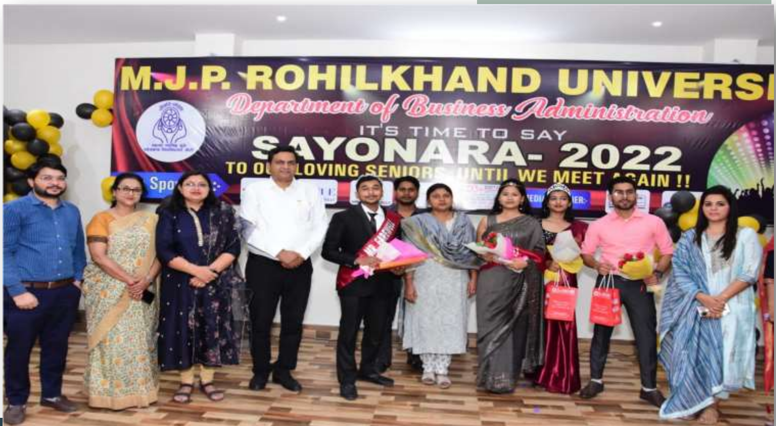
Department of Business Administration