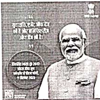
WhatsApp Image 2023-12-14 at 5.20.56 PM.jpeg 184K