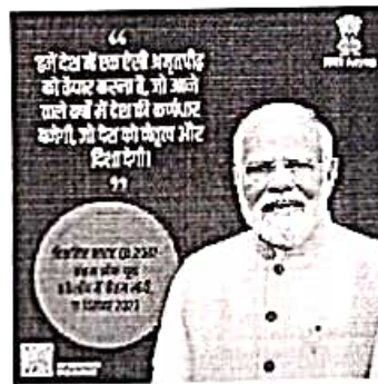
WhatsApp Image 2023-12-14 at 5.20.57 PM.jpeg 225K