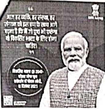
WhatsApp Image 2023-12-14 at 5.20.55 PM.jpeg 288K