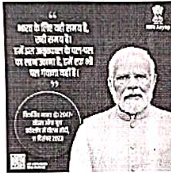
WhatsApp Image 2023-12-14 at 5.20.56 PM (1).jpeg 246K